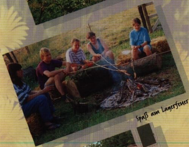
Spaß am Lagerfeuer